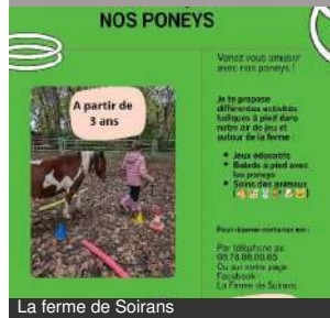
La ferme de Soirans