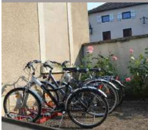
Office de tourisme du canton de Pontailler-sur-Saône

01/06/2026 au 13/09/2026 de 10h00 à 12h30 et de 13h30 à 18h00