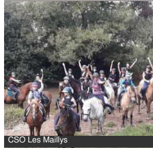
CSO Les Maillys