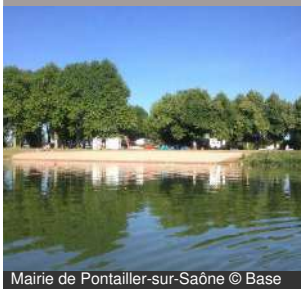
Mairie de Pontailler-sur-Saône © Base