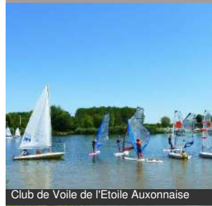
Club de Voile de l'Etoile Auxonnaise