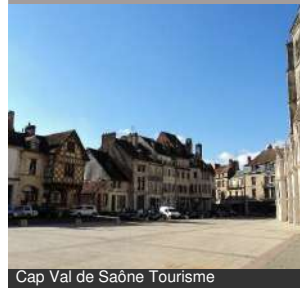
Cap Val de Saône Tourisme