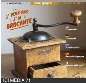
ICI MEDIA 71