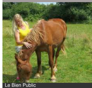
Le Bien Public