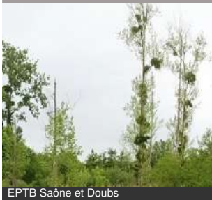
EPTB Saône et Doubs