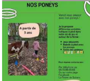
La ferme de Soirans