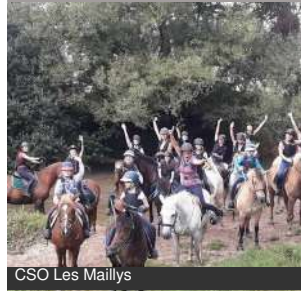
CSO Les Maillys