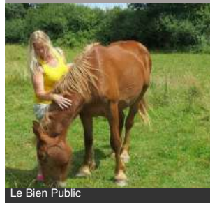
Le Bien Public