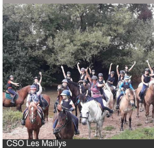
CSO Les Maillys