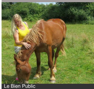
Le Bien Public