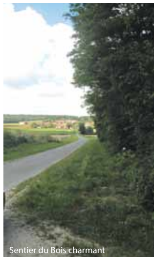
Sentier du Bois charmant

© IGN - PARIS 2014 (fond cartographique) Réalisé par l'Institut Géographique National. Extrait de la carte issue de la BO Carto® © IGN - Saint-Mandé 2014 - Autorisation n°5014-004 © Côte-d'Or Tourisme 2014 - DIJON (surcharges thématiques) Édité par la Communauté de communes du canton de Pontailleur-sur-Saône. Les renseignements sont donnés à titre indicatif et n'engagent pas la responsabilité du directeur de publication. Ce document n'est pas contractuel. © Février 2014. 200 exemplaires. Impression : ICO Toute reproduction ou adaptation, sous quelque forme que ce soit, même partielle, interdite pour tous pays.