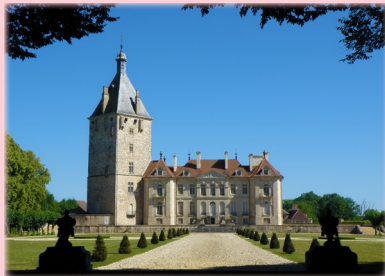
@L'écho des communes