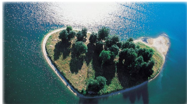
@Réserve écologique Côte-d'Or

Visite de la réserve écologique Visite guidée